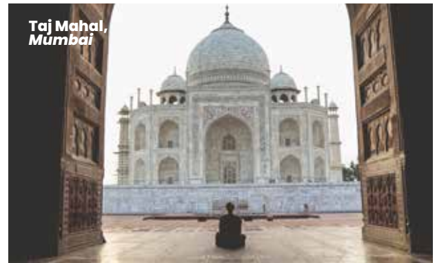
Taj Mahal, Mumbai