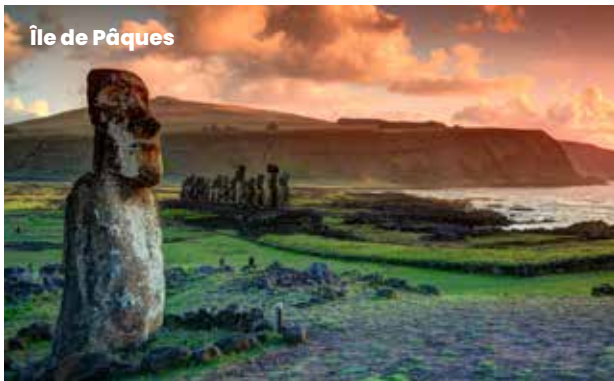
Île de Pâques